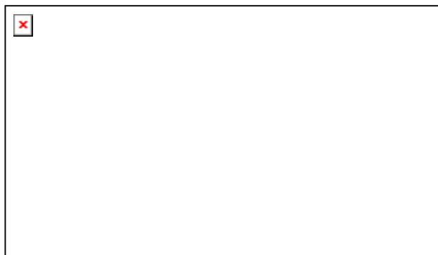
Рисунок 1 - Общий вид машины Л-116-01

1-шайба; 2- шплинт; 3- отверстия регулировочные; 4- заслонка нижняя 116.00.120; 5- тяга 116.00.100; 6- окна выпускные; 7- заслонка верхняя 116.00.110